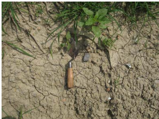
圖說：地表上散佈細碎之泥質灰黑陶片