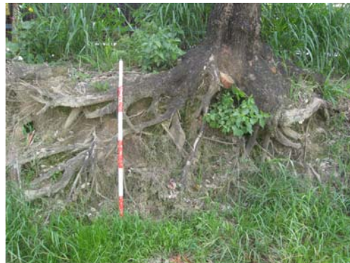
圖說：樹根內可見夾雜有夾砂陶片